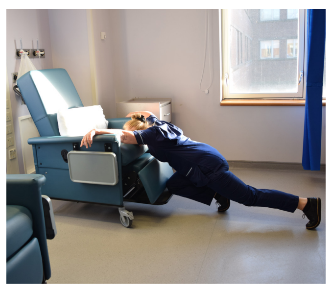
Or you may end up like this!