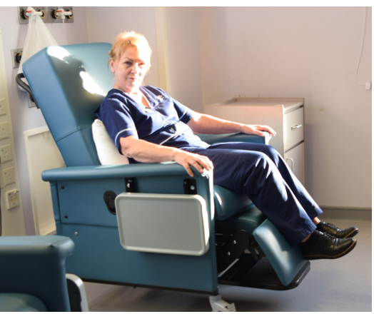
Push the leg support in securely before getting off the chair. Remember! step on the footrest as you get off the chair.