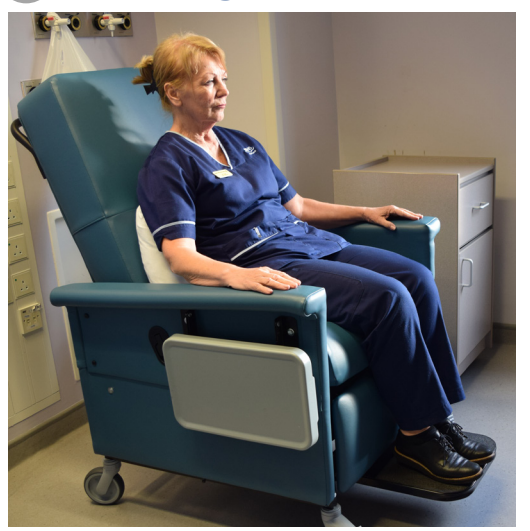
This is the normal sitting position with the footrest out .