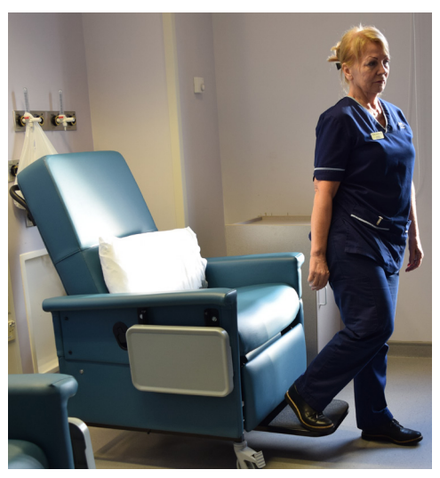
Always step on the footrest first before getting off the chair.