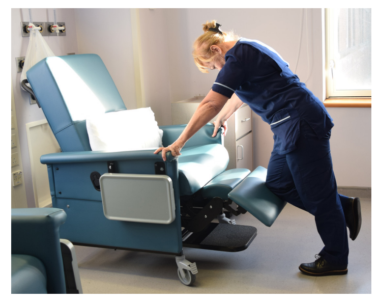
Do not attempt to get on the chair when the leg support is out.